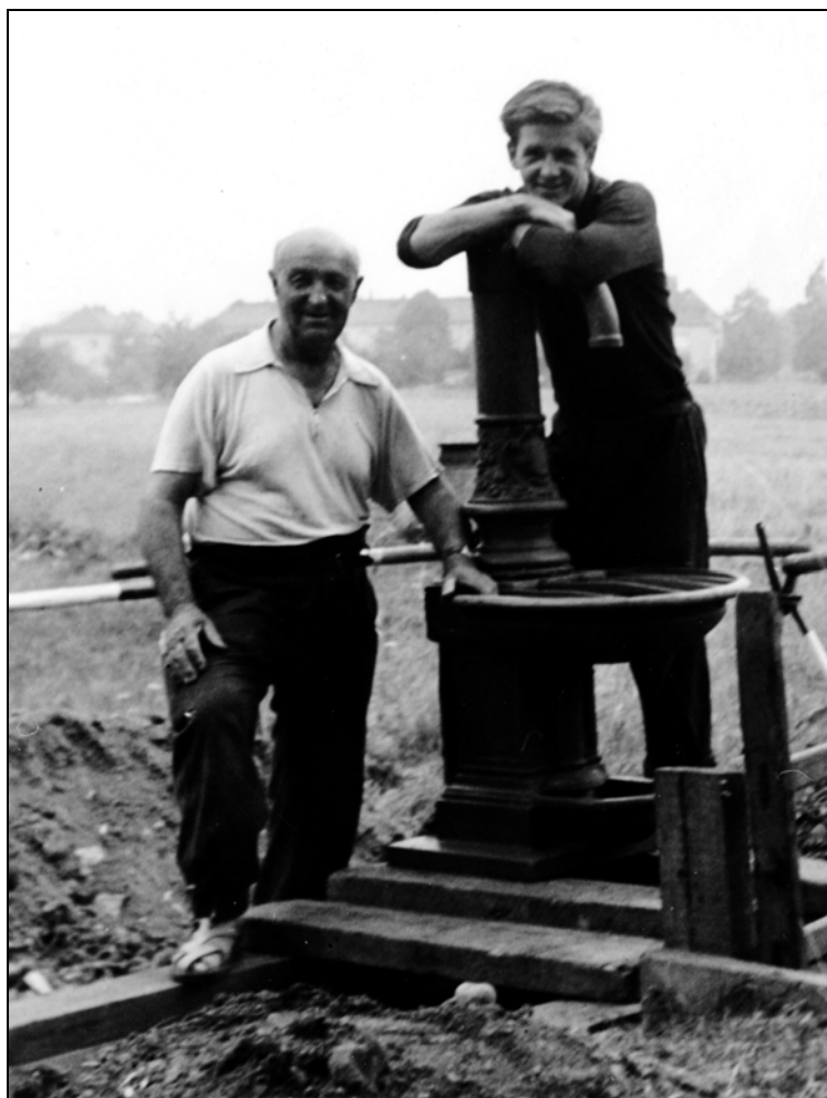
Abb. 4: Aufbau des gusseisernen Rührbrunnens, um 1960