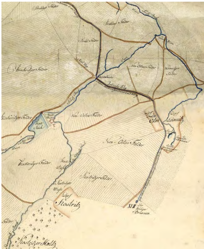
Abb.1: Quellgebiet des Heiligen Born im Generalplan von 1755

Dem Heiligen Born ist schon immer eine sagenhafte Heilkraft zugeschrieben worden; August der Starke lies sich wöchentlich mit Kurierreiter eine Kanne von dem heilkräftigen Wasser ins Warschauer Schloss bringen.